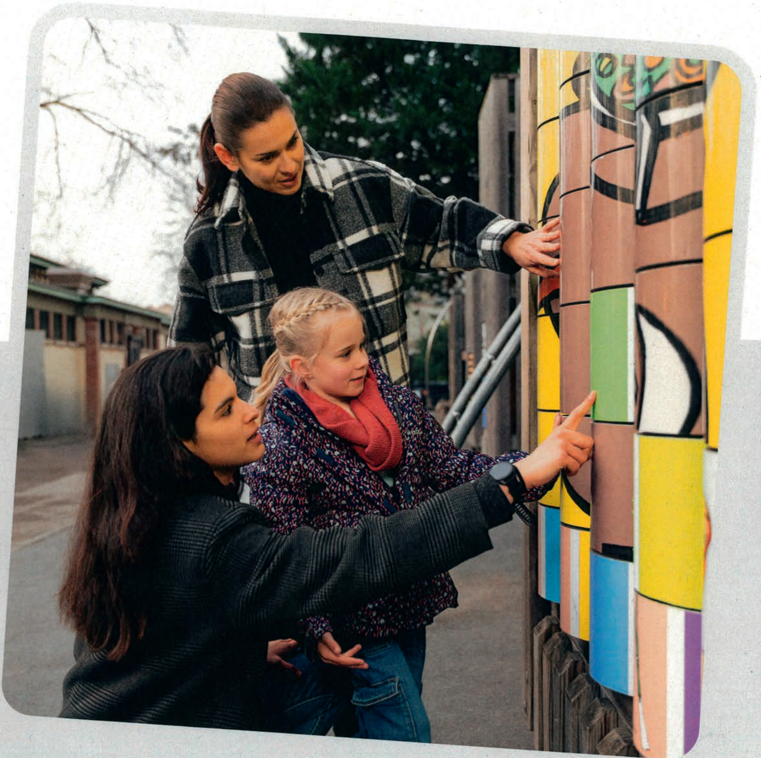
Graphisme: kurmcorp.ch